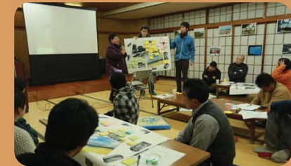
記憶を語るまちづくりワークショップ(本吉地域)