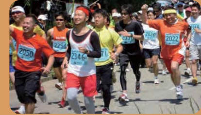
気仙沼ランフェスタ(大島)