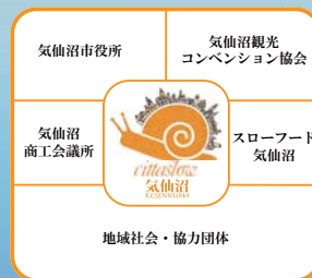
スローシティ推進主体グループ

気仙沼市震災復興・企画部 震災復興・企画課 政策・調整係 TEL: 0226-22-6600 FAX: 0226-24-8605