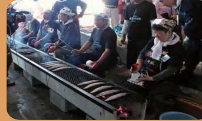
市場で朝めし(気仙沼地域)