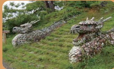
龍が見まもる安波山公園(気仙沼地域)