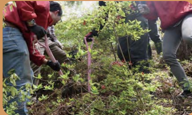
植樹祭(気仙沼地域)