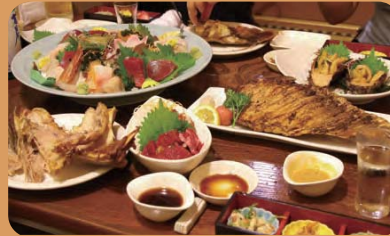
ホヤ、モーカの星(サメの心臓) ハーモニカ(メカジキの背肉煮)あざら(メヌケと白菜の酒粕煮)