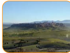
本部のあるオルヴィエート (イタリア)