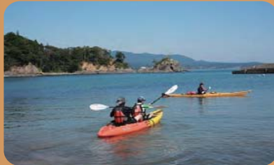
豊かな海でシーカヤック(本吉地域)