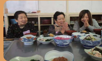
みんなで料理(唐桑地域)